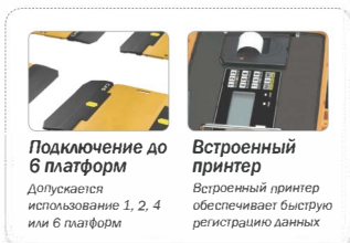
Портативные автомобильные весы